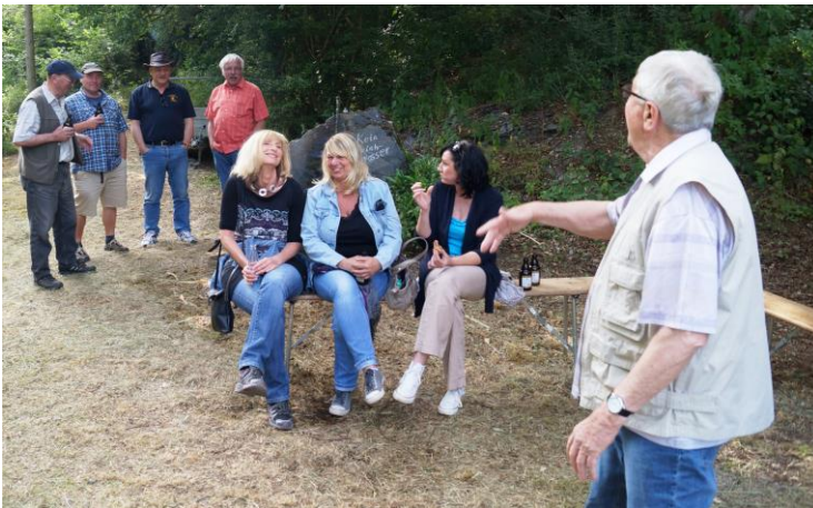
Kommt, auf, singt noch e mol mit.