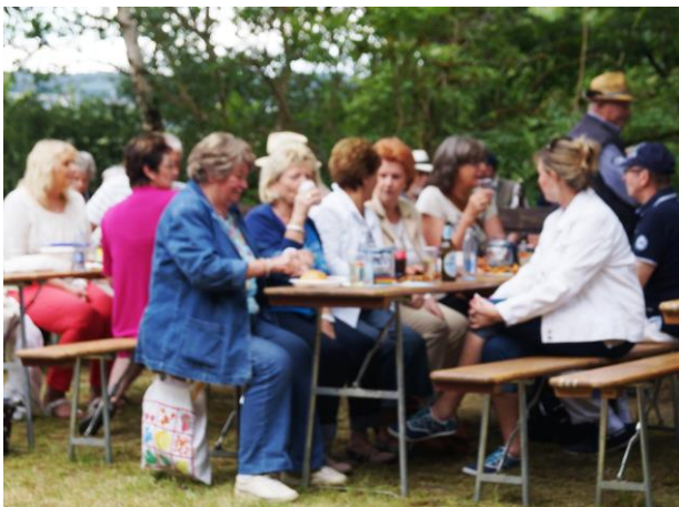
Auf der Schäg lässt sich gut feiern.