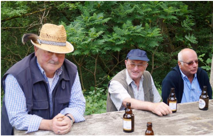
Unter Sängern lässt es sich gut Leben.