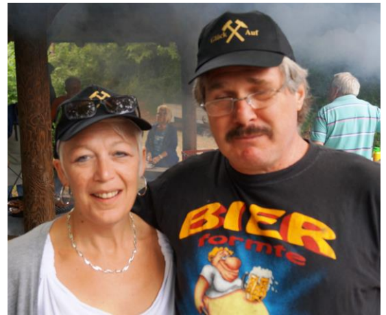
„Mir stehn die Träne in de Aue, weil ihr schunn wirrer hemfahrt!“