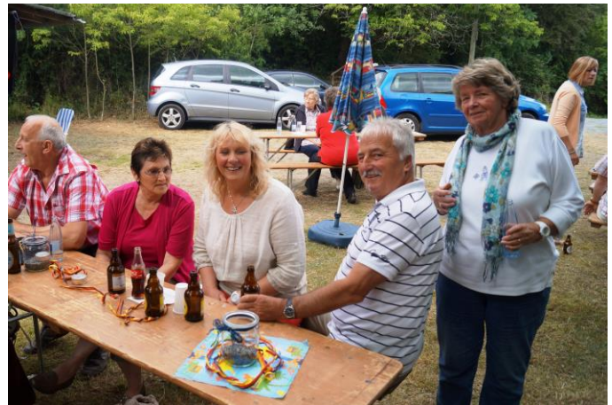
Ein schöner Tag, den man nicht vergisst.