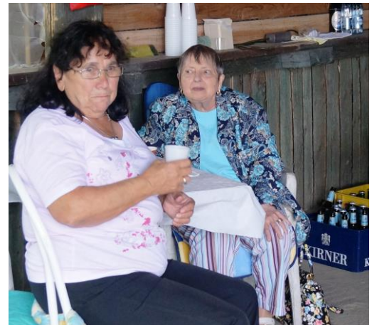
Ich glaab, mir schmeckt nix mehr.