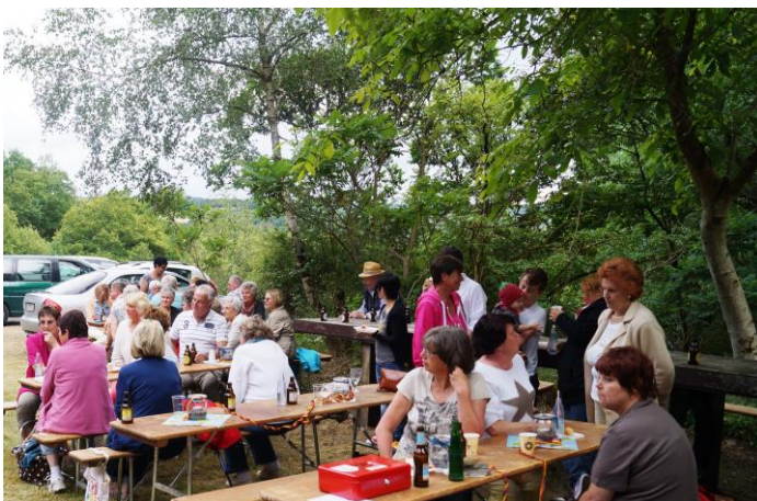
Die Zuhörer lauschten dem Gesang der Knappen.