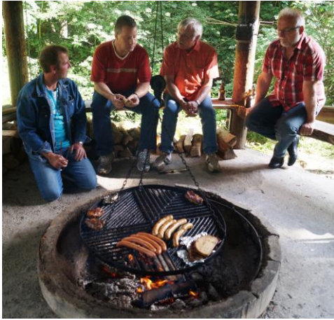
Sind dass vielleicht neue Sänger.