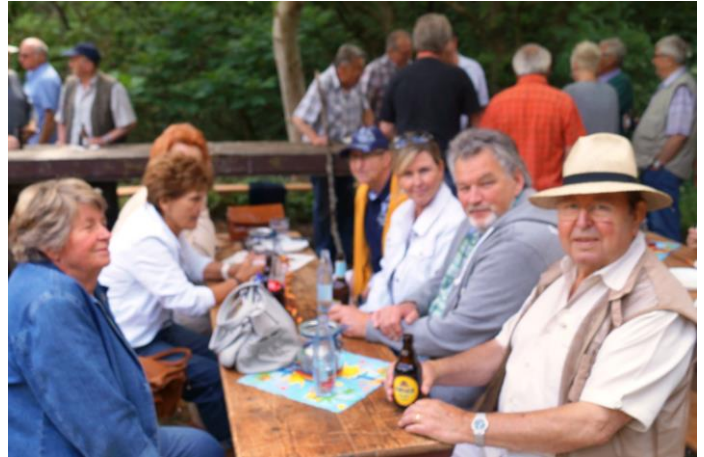
Im Hunsrück lässt es sich gut Leben.