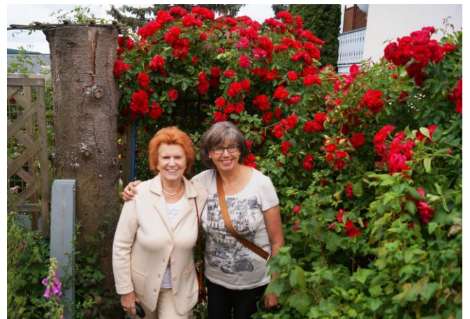
Ein Besuch bei Dornröschen im Rosengarten durfte nicht fehlen.