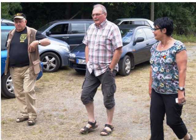
„Ich glaab mer gehen wirrer!“