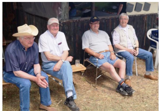
„Mir bleibe noch e bissje!“