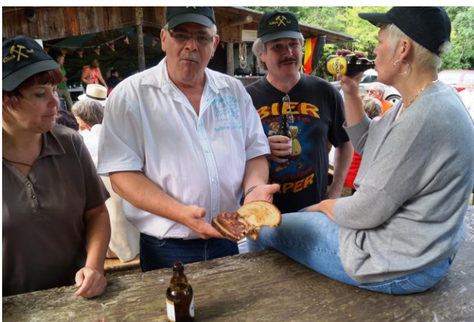
Gell Tom, das sinn Schmiere, do könnt ihr gucke.