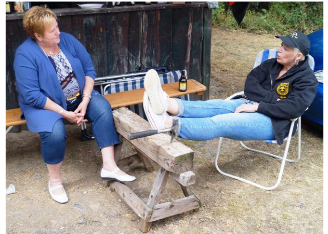
Es darf genagelt werden. Die Damen aus dem Saarland warten schon sehnsüchtig darauf.