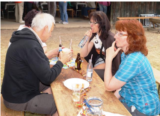
Auch Wasser hat Geschmack, oder?