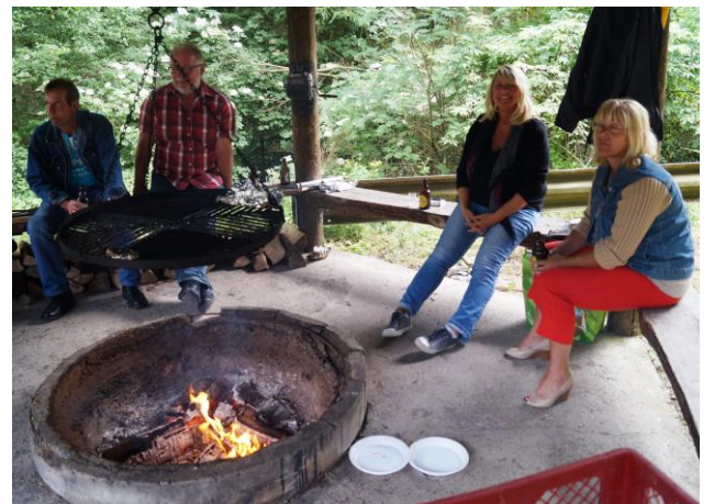
Lagerfeuerromantik pur, vielleicht?