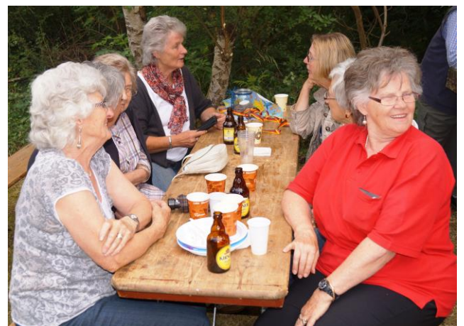
Der Fanclub aus Bundenbach.