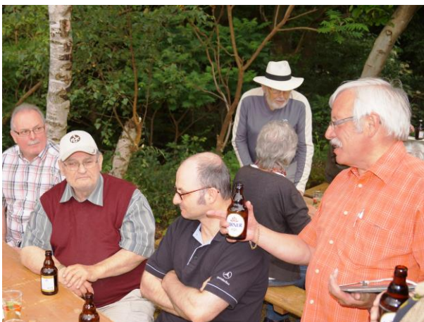
Vergesst mir das Trinken nicht.