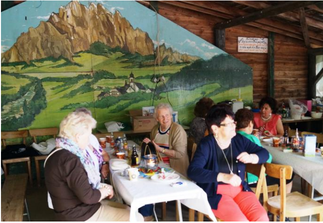
In der Cafeteria gab es süße Überraschungen.