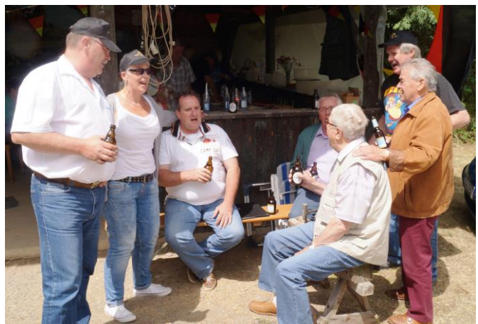
Immer wurde ein Lied angestimmt.