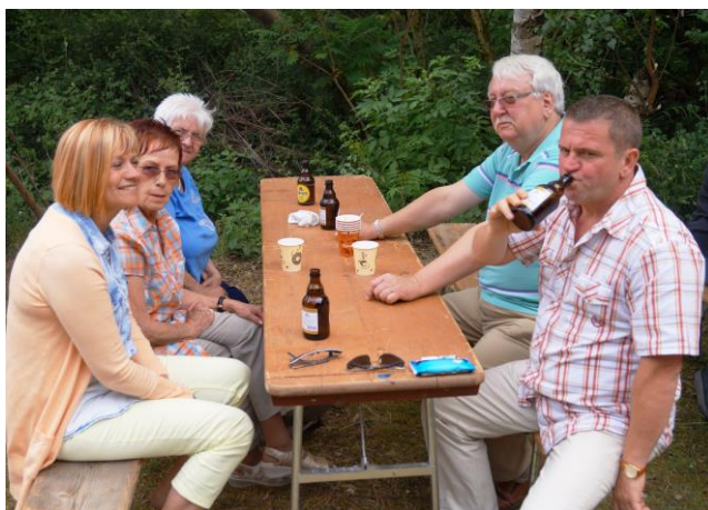
Gäste aus dem Saarland.