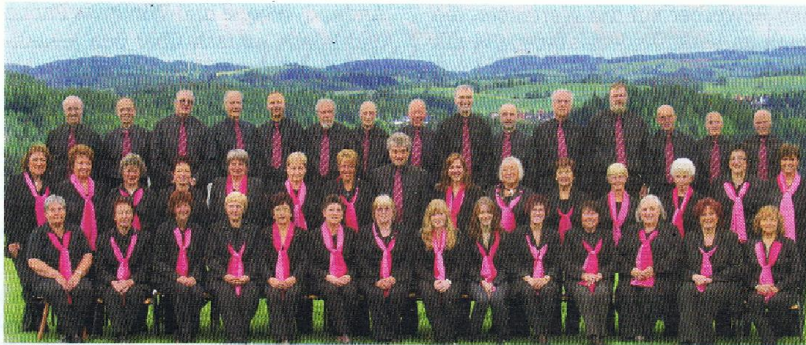
Der „Gesangverein ‚Eintracht‘ Reichenbach“ mit derzeit 35 Sängerinnen und Sängern errang bereits viermal den Titel Meisterchor im Chorverband Rheinland-Pfalz e. V.

Nr. 1 | März 2014 | Jahrgang 65 | www.chorverband-rheinland-pfalz.de