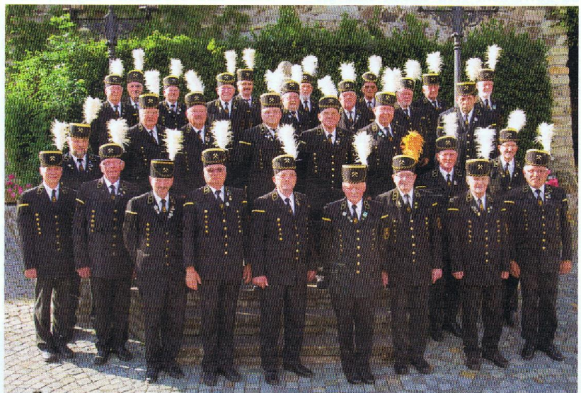
Der „Knappenchor Bundenbach 1885 e.V.“ ist der einzige Knappenchor in Rheinland-Pfalz. Die hohe Qualität ihres Chorgesangs haben die zurzeit 27 Sänger schon auf zahlreichen Benefizkonzerten und Konzertreisen gezeigt.

Das auf Birkenfeld folgende Konzert wird ein exklusives Gala-Chorkonzert des „SonntagsChores Rheinland-Pfalz“ am 17. Mai 2014 sein. Der Chor ist dann in Hagenbach/Pfalz zu Gast. Karten für das Gala-Chorkonzert sind bereits im Vorverkauf zum Preis von 10,00 Euro erhältlich bei T. Meyerer, Tel. 07273-4100 oder via E-Mail an gartenmeyerer@t-online.de. Am darauffolgenden Sonntag, dem 18. Mai, ist der „SonntagsChor Rheinland-Pfalz“ in der Staatskanzlei in Mainz zu Gast. Eine stets aktuelle Übersicht mit Beschreibungen zu weiteren Terminen erhält man auf http://fanpage.sonntagschor.de .