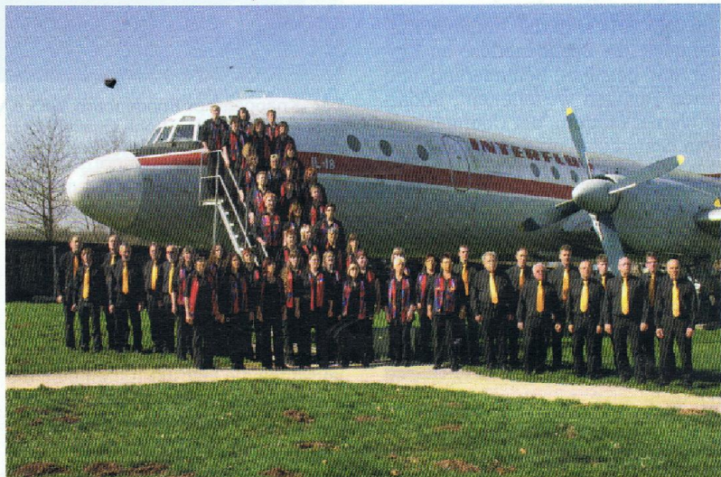
Der 55-köpfige „Gemischte Chor Fohren-Linden“ ist mehrfacher Meisterchor im Chorverband Rheinland-Pfalz e.V.

„Kinderglück im Klang der Herzen“ lautet das Motto, unter dem der „SonntagsChor Rheinland-Pfalz“ im ganzen Bundesland als Konzertpartner der Lotto Rheinland-Pfalz Stiftung